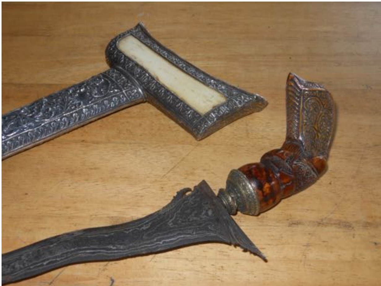
« Kris malais du sultanat de Patani en acier damassé, bois précieux, ivoire et argent repoussé (Thaïlande du Sud) »

Centre de recherche sur la paléobiodiversité et les paléoenvironnements (CR2P, UMR 7207 CNRS & Muséum national d'Histoire naturelle univ. Paris 6, Sorbonne univ., univ. P. et M. Curie)