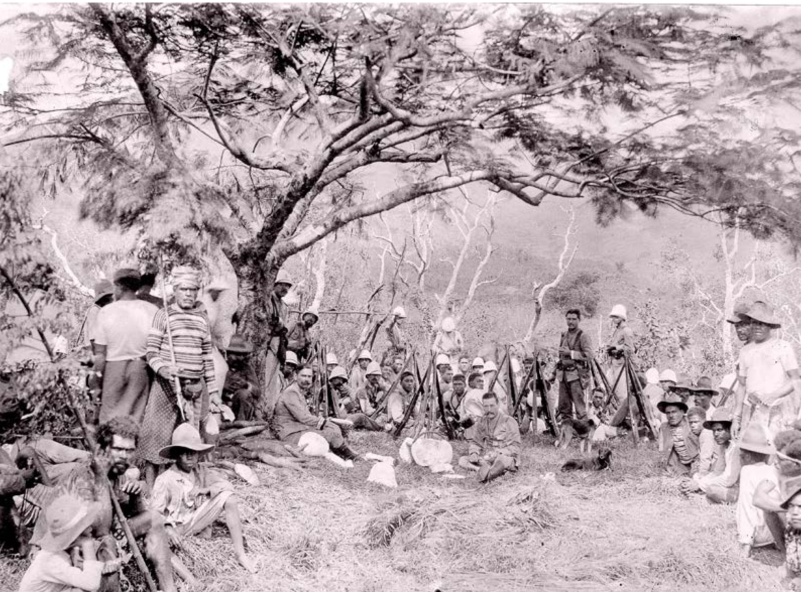
Auxiliaires kanak en soutien aux militaires français pendant l'insurrection de 1917 qu'il est plus juste d'appeler la guerre de 1917, région nord, Nouvelle-Calédonie.

© Archives de Nouvelle-Calédonie, 2 Num 9-374.