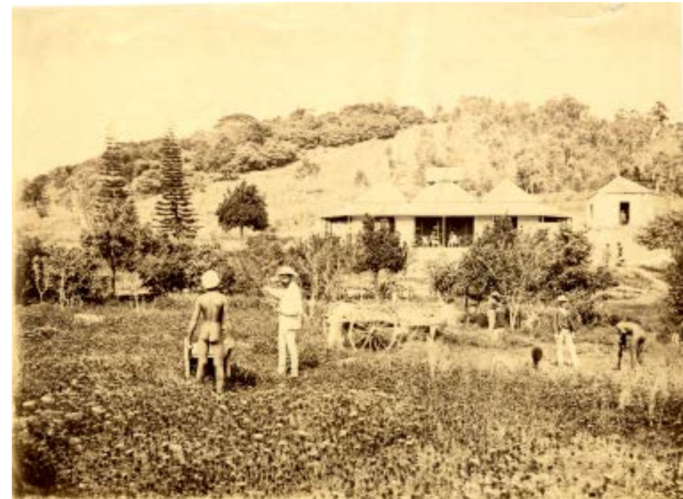
La propriété Clavel à Port Despointes, Nouvelle-Calédonie, 1874. ©Archives de Nouvelle-Calédonie, 175 Fi2.

Le travail est une valeur centrale du projet colonial, élevé au rang de levier moralisateur ou civilisationnel. La « mise au travail » des Kanak et des Ni-Vanuatu ainsi que l'exploitation des travailleurs importés est un objectif constamment réaffirmé dont la photographie témoigne dans de multiples situations. Mais le travail est aussi vanté pour ses vertus rédemptrices pour les condamnés envoyés en Nouvelle-Calédonie tout autant qu'il constitue un pilier moral pour les familles de colons libres pour qui il faut travailler autant que faire travailler.