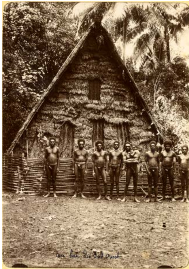
Maison des hommes de la baie du sud-ouest, Malakula, Vanuatu. ©Archives de Nouvelle-Calédonie, 198Fi069.

Des maisons traditionnelles kanak et ni-vanuatu, à la maison à deux étages d'un colon prospère en passant par les petites maisons en torchis pour les condamnés du bagne ou pour les « petits colons » ou les baraquements pour les engagés d'origine asiatique aux sommets des massifs miniers calédoniens ou sur les plantations au Vanuatu, les formes d'habitats témoignent de mondes sociaux différenciés, voire ségrégués.