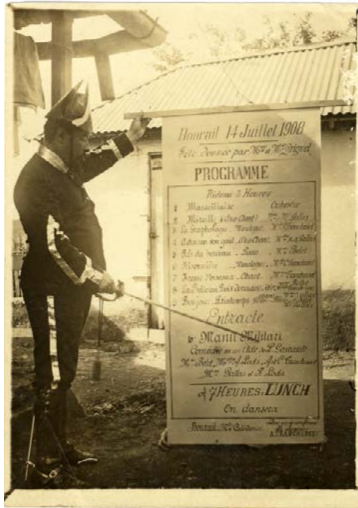
Programme du 14 juillet 1908 à Bourail, Nouvelle-Calédonie.

Malgré la pesanteur oppressive du contexte colonial, la fête fait aussi partie de la vie. Les fêtes « indigènes », coutumières ou communautaires sont sous le contrôle des autorités coloniales tandis que sont encouragées les fêtes religieuses, agricoles ou républicaines, autant d'occasion de cultiver l'entre soi ou de permettre la mixité, les croisements ou les rencontres.