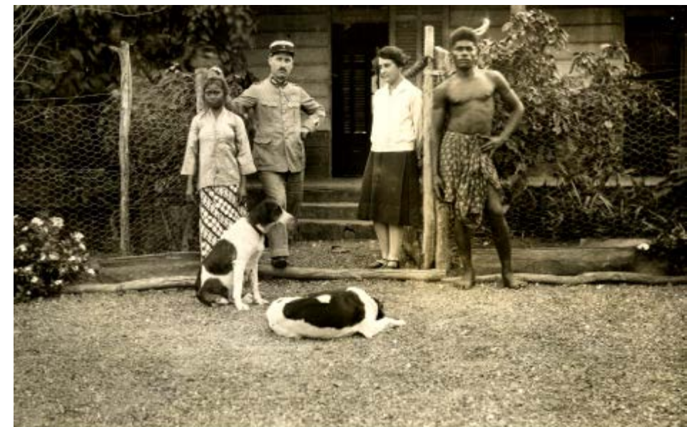
Un gendarme et sa femme avec leurs domestiques, Nouvelle-Calédonie. Autour de 1930 ©Archives de Nouvelle-Calédonie, 148Fi13-65.

Au cœur de tout projet colonial, il y a la volonté de « surveiller et punir » les peuples conquis voués à devenir colonisés et qu'il convient de « contrôler ». La France utilisa le régime de l'indigénat dans l'ensemble de ses colonies (à quelques rares exceptions près) appliqué sous des formes particulières selon les contextes jusqu'en 1946. Le régime de l'indigénat fut mis en œuvre en Nouvelle-Calédonie à partir de 1887 d'une façon redoutablement efficace, avec comme partout, l'implication des chefs comme intermédiaires. Il ne fut, en revanche, que très partiellement appliqué au Vanuatu sur des populations qui échappaient largement à l'emprise de l'Etat. Au régime de l'indigénat, s'ajoute en Nouvelle-Calédonie, la présence du bagne et le contrôle qu'exerce l'institution pénitentiaire sur les condamnés, ex-condamnés et colons pénaux, qui constituent jusqu'aux années 1920, plus de la moitié de la population « blanche » présente sur le territoire. La pesanteur de la surveillance et l'appréhension de la punition conditionnent l'existence des Kanak, travailleurs engagés et familles de condamnés sous la période coloniale en contraste avec la situation au Vanuatu où la présence de l'Etat et de ses agents est beaucoup plus labile.