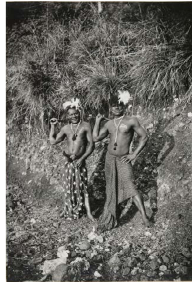
La mode du manou, Nouvelle-Calédonie, c. 1889-1919.

Couvrir les corps fut un enjeu colonial surtout dans des îles où s’habiller prend une toute autre forme. L’habillement fait partie de la mission civilisatrice mais il constitue aussi un instrument d’affirmation identitaire, de résistance et de distinction. Les photos présentées illustrent l’extrême variété des façons et des possibilités de se couvrir dans un contexte où se côtoient condamnés, riches et pauvres colons, insulaires, engagés « tonkinois » (vietnamiens), javanais ou autres.