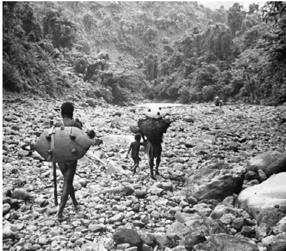
Ni-Vanuatu circulant dans le lit d'une rivière sur l'île Espiritu Santo, 1900-1910

Kanak et Ni-Vanuatu circulaient aisément sur les sentiers, dans les montagnes ou dans les plaines, et naviguaient le long des côtes sur des pirogues dans le lagon jusqu'en en haute mer. Pour les Européens, les déplacements par la mer furent longtemps les plus faciles par cabotage pour atteindre les centres de colonisation le long des côtes. En revanche, la circulation par voie de terre, la construction de routes charretières et l'installation des bacs sur les rivières exigèrent de terribles efforts, accomplis en Nouvelle-Calédonie par les condamnés du bagne. Les dénivelés, la lutte contre une nature foisonnante, le ruissellement des eaux lors des cyclones, autant de facteurs qui firent des routes, en Nouvelle-Calédonie comme au Vanuatu, un enjeu majeur économique et une urgence pour rompre l'isolement des colons.