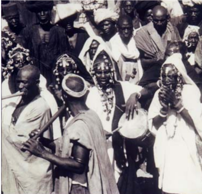
Photographie, Collection ethnographique de l'université de Strasbourg ©Collection d'objets ethnographiques - UMB - 394

propres notes à l'aide d'un véritable balafon ou d'enregistrer ses propres sons grâce au dispositif sonore de la « boîte à son. »