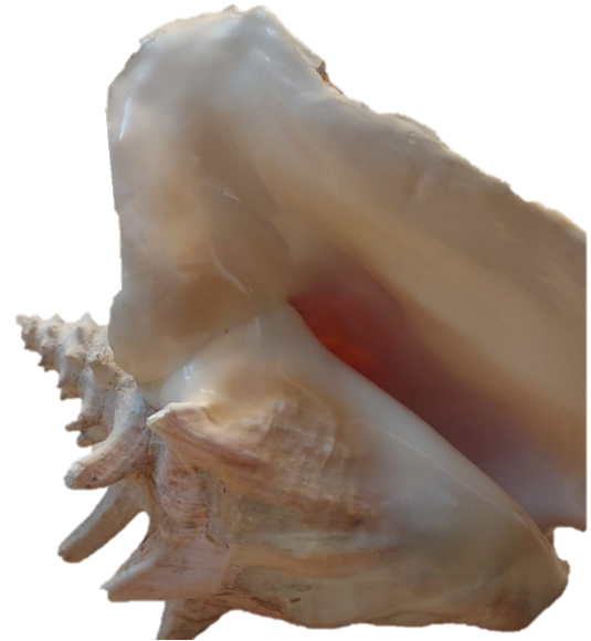
Conque ; Collection privée

Le visiteur sera amené à pénétrer dans une salle de classe pour en apprendre plus sur la production du son et sa résonance par les ondes. Grâce à des expériences et des appareils scientifiques, il pourra se plonger dans l'univers des sons. Le coquillage est l'un des premiers instruments de musique de notre humanité. Avec lui, l'Homme a découvert la portée des ondes sonores. À son tour, le visiteur pourra en prendre conscience grâce aux instruments de mesures des ondes, prêtés par le Jardin des Sciences de l'Université de Strasbourg.