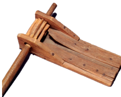
Crécelle ; Collection ethnographique de l'université de Strasbourg 492

Plongé dans l'atelier du luthier, le visiteur découvrira les essences de bois utilisées pour la fabrication de certains instruments, il sera spectateur du travail de l'artisan qui l'invite à découvrir son métier. Guidé par les odeurs de sciure, il aura l'occasion de faire appel à tous ses sens à l'aide d'une table sensorielle. En relation direct avec le luthier, le spectateur contempera pas à pas les étapes de fabrication des instruments.