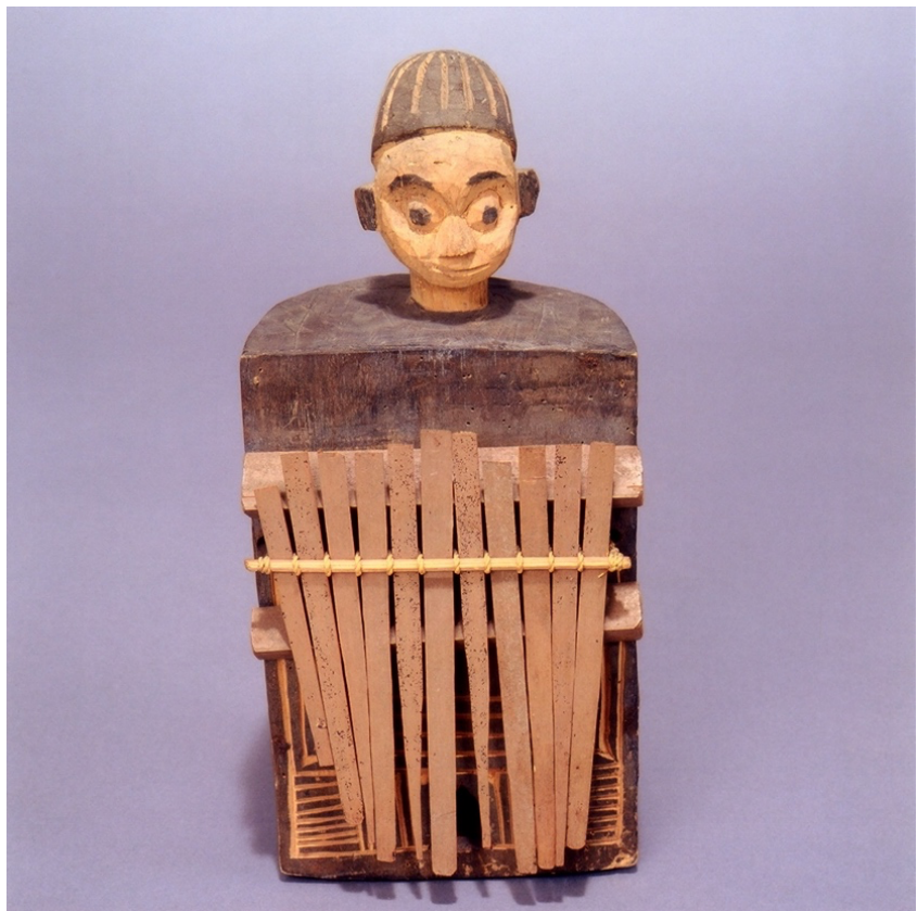
Sanza ; Collection ethnographique de l'université de Strasbourg ©Collection d'objets ethnographiques - UMB - 487

Une expérience sensorielle dans le monde du son et de la musique