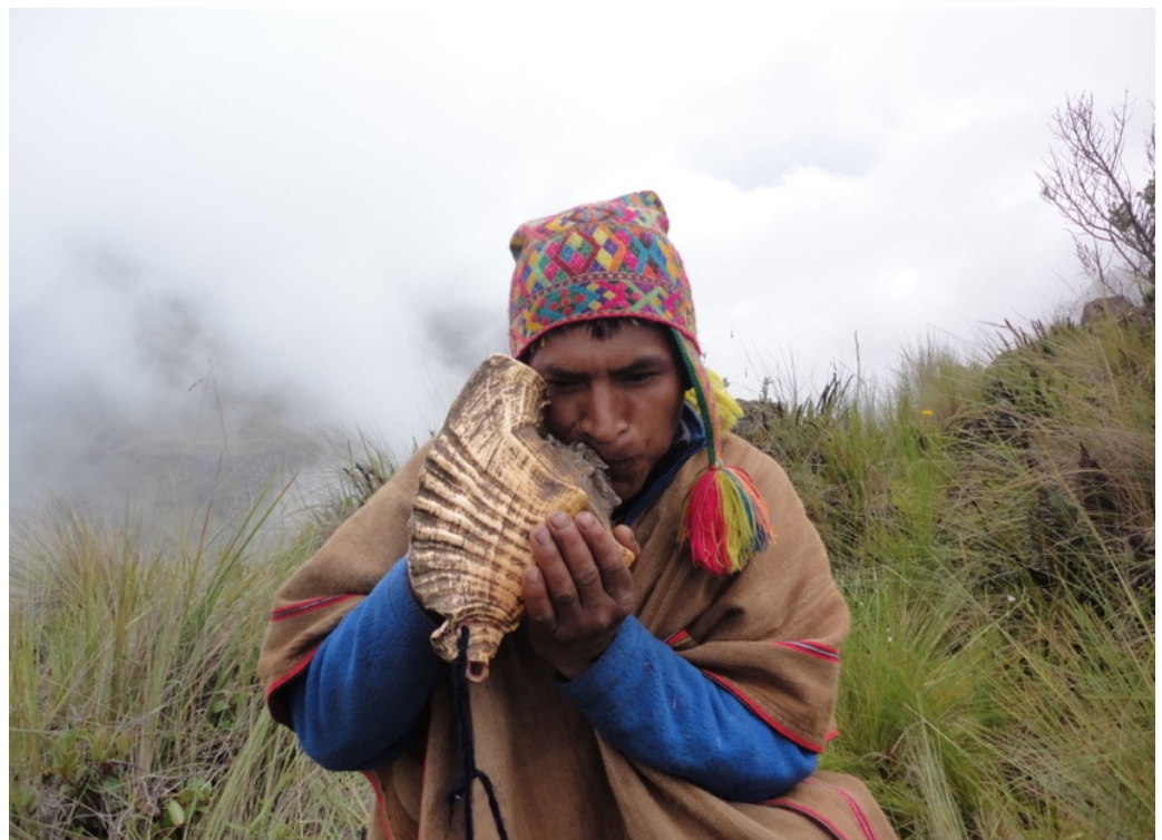
Photographie d'un Q'ero jouant un pututu